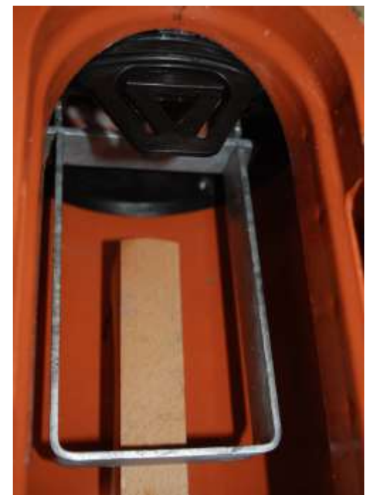
Innenenteil löst sich und wird herausgedrückt