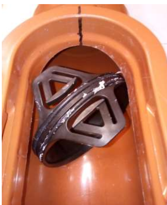
Ausbauwerkzeug entfernen, Innenenteil um 90° drehen und herausnehmen