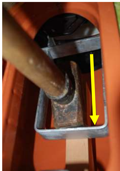
mit Hammer gegen Ausbauspanne schlagen