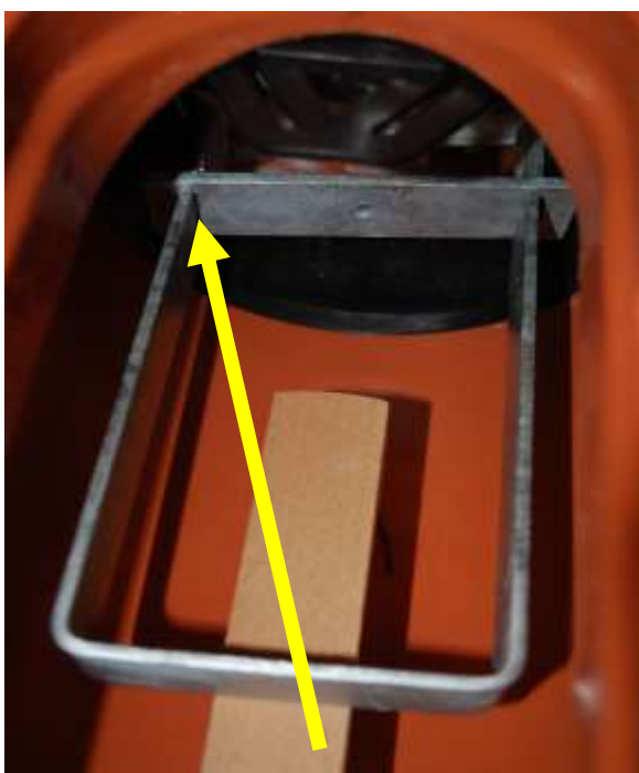
Fixierung mit Nut auf Ausbauspanne schieben und fixieren