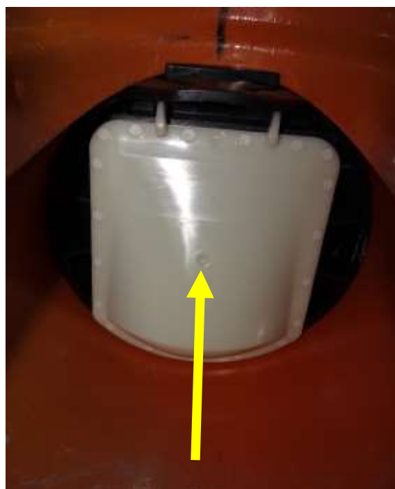
Klappe von 2. Innenenteil lösen und Innenenteil ebenso demontieren