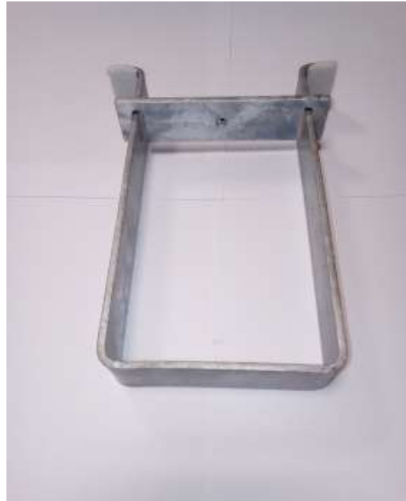
Ausbauwerkzeug im fertigen Zustand