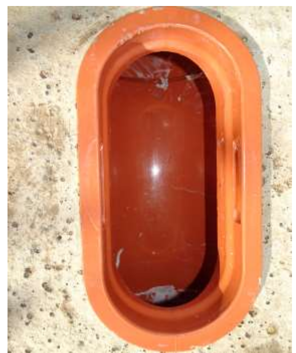
danach kann inspiziert und im Bedarfsfalle gereinigt werden